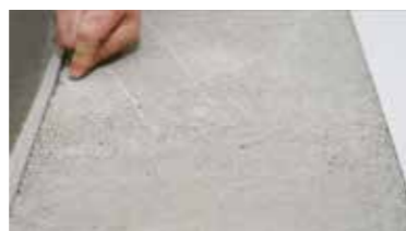
JASTRYCH CEMENTOWY sprawdzenie twardości i czystości