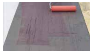
METAL Keragrip Eco