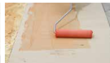
PVC Keragrip Eco