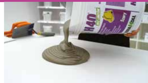
Mieszanka tiksotropowa i płynna

H40 ® Bez Limitów ® jest tiksotropowy w każdej warstwie, łatwy do nakładania i lekki. Także na ścianach pracujesz bez wysiłku i sptywania płytek.