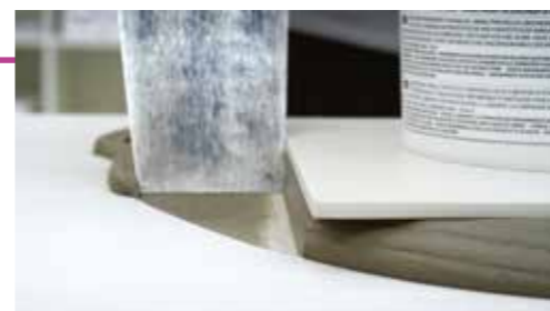
Nie zapada się

“ Byłem zmęczony robieniem kleju na gęsto dla podpierania płytek. Z H40 ® Bez Limitów ® wypróbowałem nową konsystencję tiksotropową i płynną, która pozwala mi na lepszą i pewniejszą pracę. ”