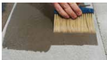
BETON sprawdzenie nasiąkliwości